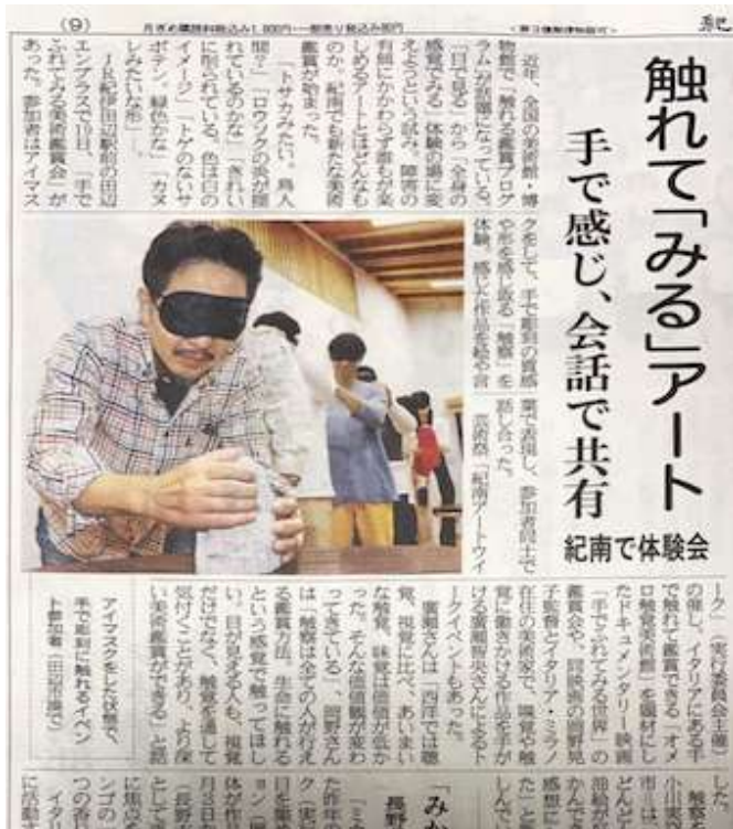
紀伊民報で紹介された紀南アートウィーク2023