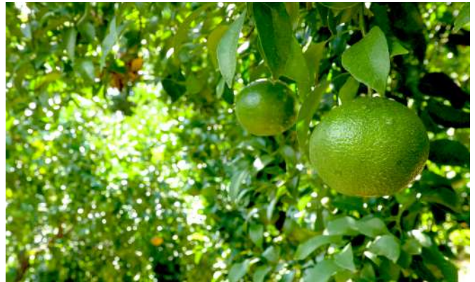
摘果みかん

こういった「統合現象」は、自分のこれまでの生き方からすれば当然の帰結だろうし、また「統合が善で乖離が悪」というわけではなく、おそらく繰り返していくのだろうというのも、直感している。冬のバレンシア畑より。