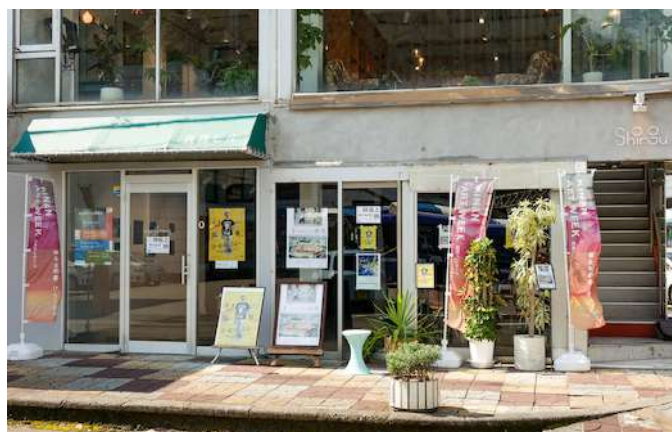
上映会場となったJR白浜駅前のノンクロン

目の見えない人はどうやってアートを鑑賞しているのか？というテーマで日本とイタリアから、それぞれ視覚障害のある方がアートにふれる姿を描いた映画2本の上映会と岡野監督による触覚のワークショップ。こちらは紀南民報でも取り上げられました。 https://kinan-art.jp/info/14074/