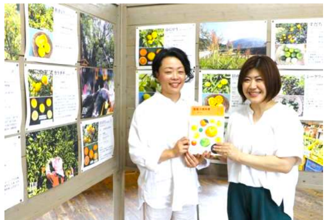
紀南初の柑橘ソムリエ講座