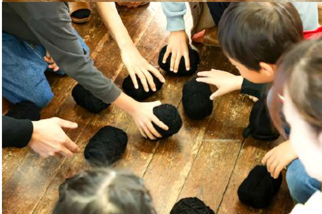
触れてみる感覚を楽しむ様子