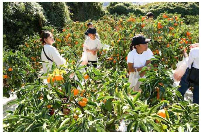
みかん農園で感覚を研ぎ澄ます

プログラムは、農園のみかん畑の中で、収穫体験や触覚、嗅覚、味覚などフルに働かせ身体感覚がすまされる体験をしていただきました。参加者の多くが田辺在住の方々に、みかんの産地に住んでいらっしゃるようですが、みかん畑を訪れる体験は初めてということで、大きな関心と喜び、楽しさを共有いただきました。特に人気のひとつだったことは、みかん畑がある山の登頂部までの軽トラックの小さな旅でした。スリル満点のプチ旅行も含めて感覚が研ぎ澄まされた体験だったと思います。