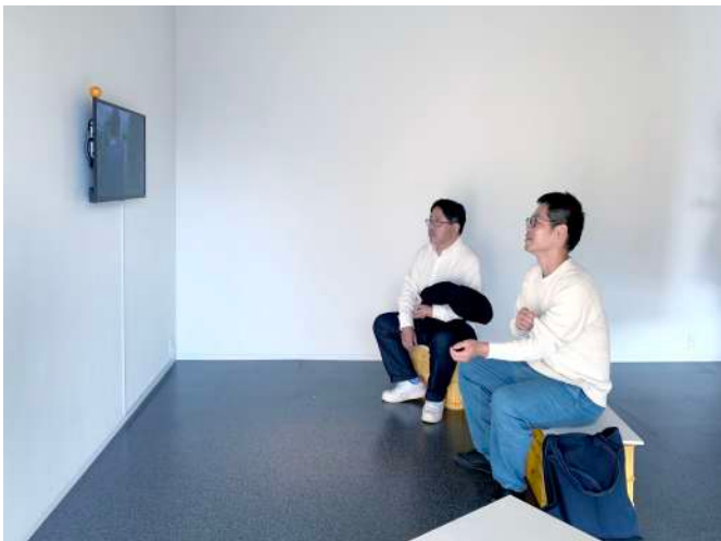
記録映像を鑑賞中の様子

利用したもので建てられています。みかんたちは、たまにこの家から出て旅にも出ます。紀南から長野へ、長野からイタリアへとみかんの旅は続きます。そして、空間の中央には、昨年、摘果みかんで作られたみかんの紙も配置し鑑賞者はその紙にも触れることができます。その背後には、紀南のみかん畑をリサーチした際の映像も流れて、鑑賞者は紀南のみかん畑へと誘われいきます。