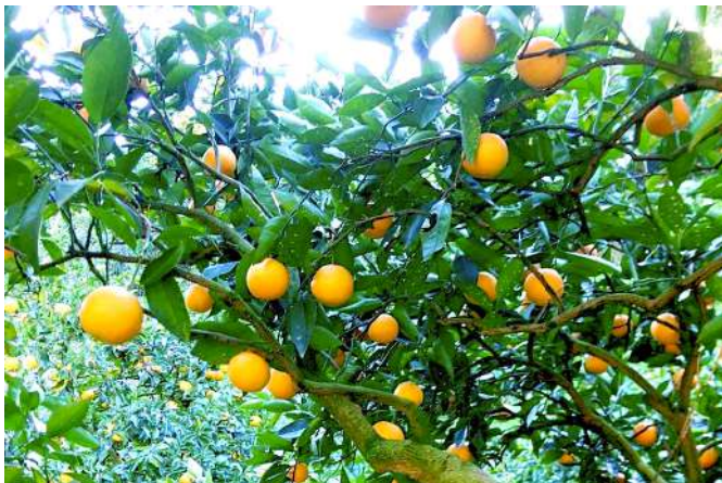
バレンシアオレンジ

しかし更に何年か経つと、摘果が遅れているなあという「勘定」は働きつつも、朝日がきらきらしてくれいだなという「感動」を、別の小部屋で並行して行えるようになった。