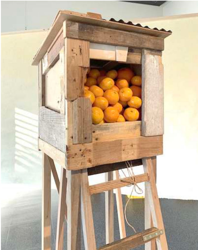
みかんのための家（部分）

利用したもので建てられています。みかんたちは、たまにこの家から出て旅にも出ます。紀南から長野へ、長野からイタリアへとみかんの旅は続きます。そして、空間の中央には、昨年、摘果みかんで作られたみかんの紙も配置し鑑賞者はその紙にも触れることができます。その背後には、紀南のみかん畑をリサーチした際の映像も流れて、鑑賞者は紀南のみかん畑へと誘われいきます。