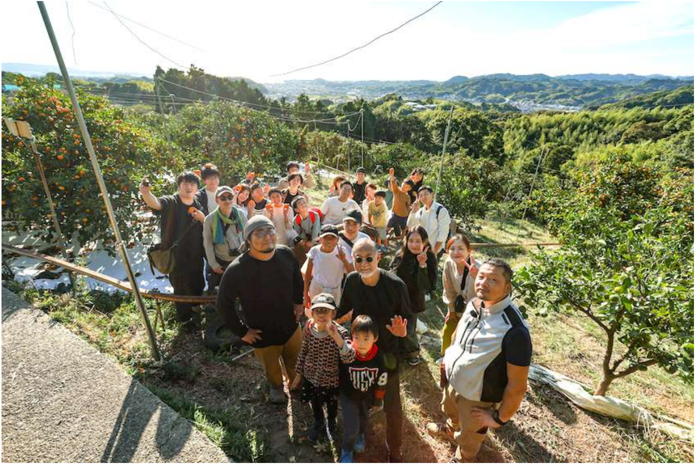
尖農園でのワークショップに参加した皆さんの集合写真, 2023