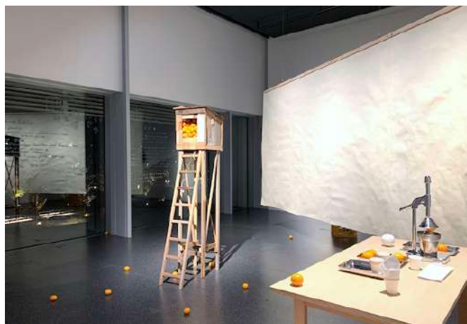
みかんの旅展示会場風景

この展覧会が開催されることになった経緯は、昨年開催されていた紀南アートウィーク2022に長野県立美術館の学芸員の方がお越しくださり、みかんに関心をもっていただいたことがきっかけになりました。アートラボでの企画として、身体を刺激する、みかんの香りや< commons 農園 >の新たな価値の創造という考え方などが、美術館のコンセプトとも合致しました。