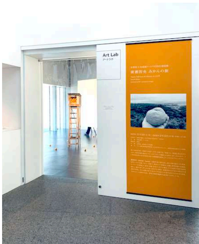
作品が展示されている長野県立美術館のアートラボ会場

2023年11月3日から2024年2月12日まで、長野県立美術館において「みかんの旅」展が開催されています。この展覧会は、昨年の紀南アートウィーク2022で発表された、アートプロジェクト< commons 農園 >の未来を予感させるインスタレーションをベースに、長野バージョンとして展示されています。