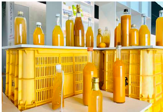
紀南のさまざまな柑橘類ジュースを並べたインスタレーション

近年開館した長野県立美術館には、視覚のみならずさまざまな感覚を使って楽しむ作品を扱うアートラボが新設され、新たなアートを楽しめるようになっています。今回の展示では匂いをキーワードに、現在紀南で進めているアートプロジェクト< commons 農園 >を紹介することになりました。