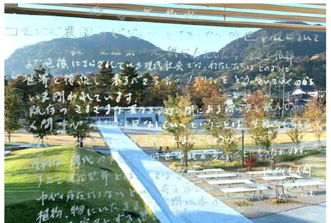
会場の窓ガラスにかかれた<コモンズ農園>のビジョン

*展覧会で使われているみかんと収穫コンテナは、すべて紀南のもので。収穫コンテナの借用と和歌山のみかんを長野まで届けていただきました。紀南のみかん農園の皆さまのご協力、改めて感謝いたします。どうもありがとうございました。