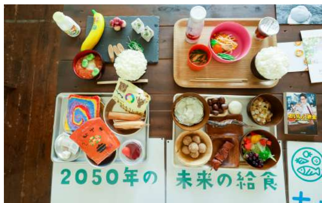
2050年の未来の給食の食品サンプル