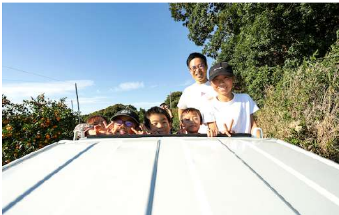
みかん農園へ移動

コモンズ農園の構想へ近づいていくきっかけ作りのひとつとして、参加者との間で目に見えない感覚を共有することを目指した体験ツアーを実施しました。実際に柑橘農園を訪れながら、みかんの栽培やみかんの知識やなどについての知識を深めるため、特にみかんや草花の香りを嗅いだり、触れたりと身体感覚を重視したツアーを行いました。ご協力いただいたのは、みかんコレクティブ「コモンズ農園」のメンバーでもあり、このコラムにすでに登場いただいている小谷さんの尖農園（とんがりのうえん）です。