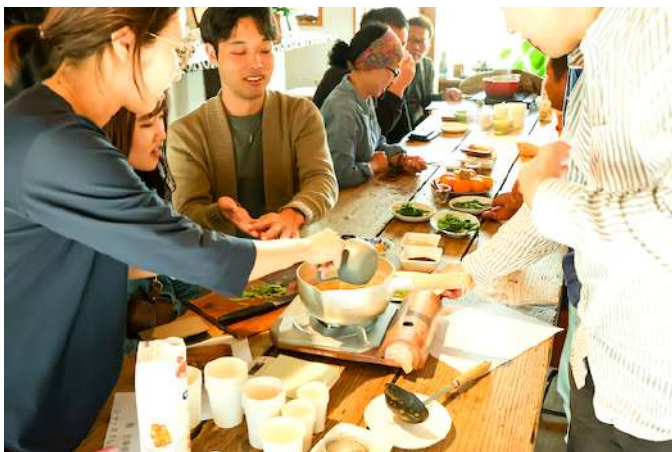
オリジナルチャイを作ってみる